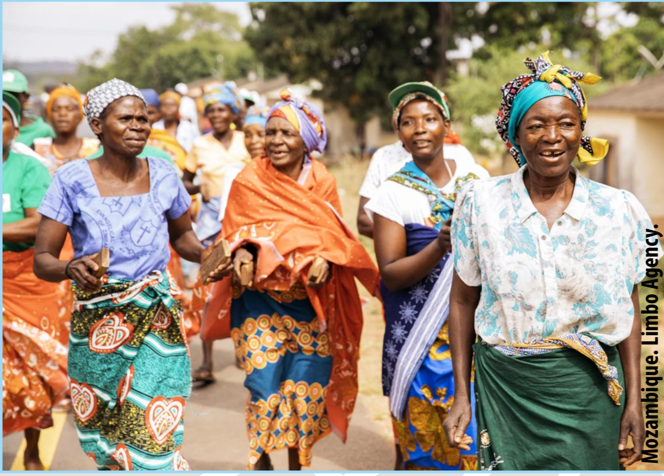
Mozambique. Limbo Agency.