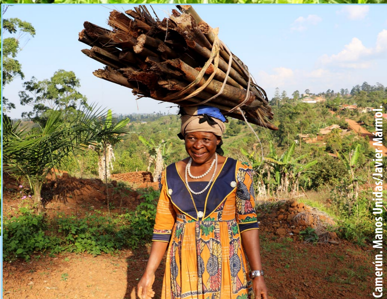
Camerún. Manos Unidas/Javier Marmol.